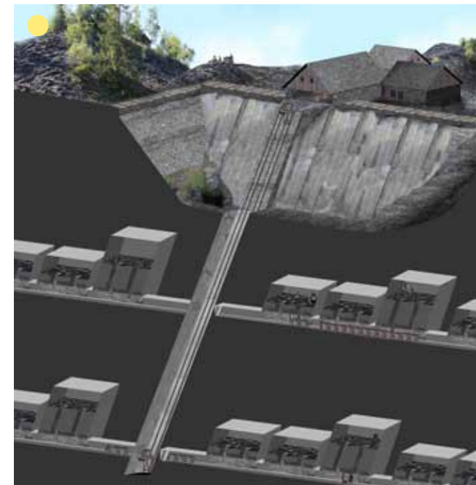
Schematický model Nittmannova dolu, Zálužné cca r. 1850