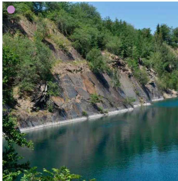
Lom Svobodné Heřmanice, r. 2019

Břidlice se v Nížkém Jeseníku sporadicky těžila a používala od nepaměti. Ve středověku byla užívána jako stavební zdící materiál, obklady a dlažby jsou dodnes spatřitelné v sakrálních stavbách. V druhé polovině 18. století její dobývání nabralo novou dimenzi. Z břidlice se začala vyrábět střešní krytina a z drobné těžby se postupně vyvinulo průmyslové odvětví – těžba a výroba pokrývačské břidlice. Nejstarší zmínky o takové činnosti sahají do roku 1775, kdy se u obce Svobodné Heřmanice těžilo v několika povrchových lomech.